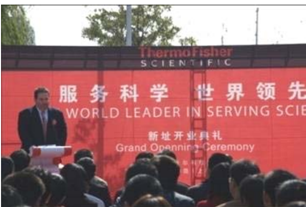
赛默飞世尔科技全球副总裁 Marc Casper 讲话

赛默飞世尔科技目前在中国拥有 4 家制造工厂，员工 1000 余名。本次落成的显微载玻片制造厂新址位于金桥出口加工区南区，占地面积达 5000 平方米，拥有员工 72 人，生产的高品质显微镜载玻片产品将全部销往海外市场。赛默飞世尔科技将在新址继续服务于科学领域，并不断创出更高的成绩。