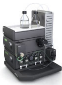
ÄKTA生物分子 纯化技术进阶培训