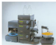
FastTrak工业 纯化技术培训